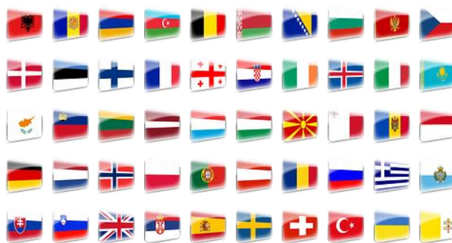
Flags of European countries

Oprócz Polski, podobnej kolorystyki i wzoru ułożenia barw używa kilka innych państw. Największe podobieństwa reprezentują flagi Monako, Indonezji, Chile oraz Czech. Miasta posiadające podobny zestaw kolorów to m.in: Wiedeń, Frankfurt nad Menem.